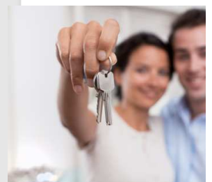
Een huis kopen