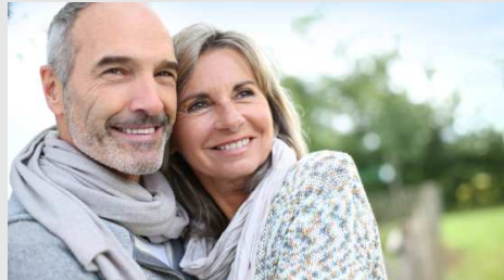
Bijna met pensioen