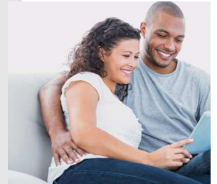
Samenwonen of trouwen