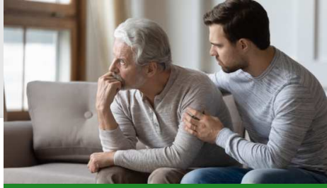
Overlijden van partner